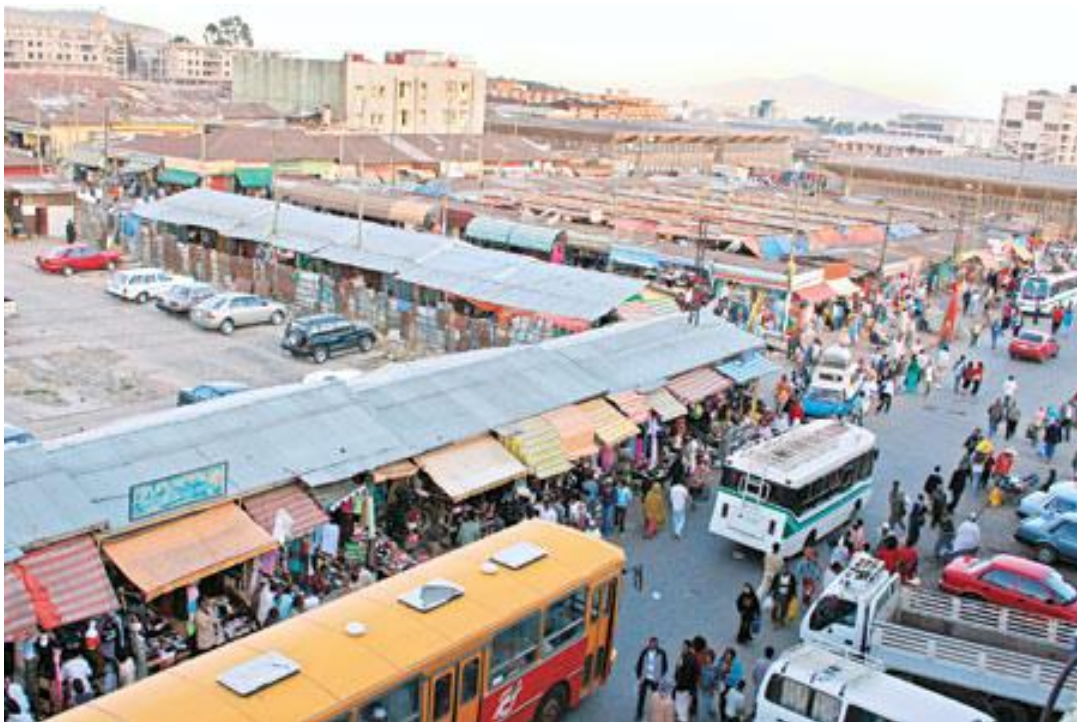
Εικόνα 18. Το Μερκάτο της Αντίς Αμπέμπα