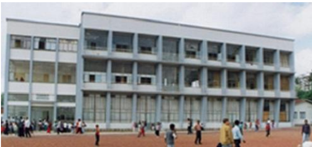
Εικόνα 3. Το Οικοτροφείο

Εκεί στη μεγάλη αίθουσα τελετών καθόμαστε και ο Σεβασμιότατος πρώτος αρχίζει να μας μιλάει με τα γνωστά πατρικά λόγια των εκκλησιαστικών αρχόντων. Φαίνεται πολύ μορφωμένος και γνώστης των προβλημάτων των Ελλήνων της διασποράς. Μας τονίζει την υψηλή αποστολή μας και κάνει μια καλή σύζευξη της Ελληνικής Παιδείας με την Εκκλησία μας. Ακολουθεί ο αδερφός του. Αυτός μας τονίζει ιδιαίτερα τη θέση μας στην καινούργια αποστολή και μας αναπτύσσει τη θεωρία ότι εμείς εδώ δεν θα είμαστε μόνο Δάσκαλοι και Καθηγητές στα ελληνόπουλα, αλλά στους ντόπιους και τους ξένους θα είμαστε μικροί πρεσβευτές της πατρίδας! Για πρώτη φορά άκουγα αυτή την άποψη και προβληματίστηκα. Ποτέ μου δεν σκέφτηκα ότι πηγαίνοντας στην Αιθιοπία θα είχα συγχρόνως με το «δασκαλίκι» μου και το ρόλο του μικρού πρεσβευτή της χώρας μου! Ούτε είχα προετοιμαστεί για κάτι τέτοιο, αλλά και ούτε κάποιος αρμόδιος από το Υπουργείο Παιδείας μου είχε μιλήσει σχετικά!