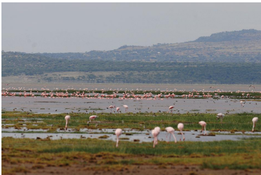
Εικόνα 28. Τα πουλιά στη λίμνη Abiata

Σιγά-σιγά με το αυτοκίνητο, καθώς στο δρόμο συναντούμε και άλλα κοπάδια από ζώα, πλησιάζουμε τη LANGANO. Βρισκόμαστε διακόσια χιλιόμετρα περίπου μακριά από την Αντίς Αμπέμπα. Ταξιδεύουμε τέσσερες ώρες και κάτι και με τις εναλλαγές του τοπίου, που συναντούμε, τους ανθρώπους, που αντικρίζουμε δεξιά και αριστερά κάτω από τις ακακίες και τα κοπάδια των ζώων με τα βόδια, τις αγελάδες και τα συμπαθητικά γαϊδουράκια, δεν καταλαβαίνουμε καλά-καλά ότι κάναμε τόσα χιλιόμετρα. Εκείνο που αρχίζει κάπως να μας ενοχλεί είναι η ζέστη. Τη νιώθουμε όλοι και τα παιδιά μας θέλουν να βγάλουν τις ζακέτες τους και ζητούν να έχουμε τα παράθυρα του αυτοκινήτου ανοιχτά. Είμαστε ντυμένοι με χοντρά σχετικά ρούχα, τέτοια που απαιτεί το κλίμα της Αντίς Αμπέμπα την περίοδο, που διανύουμε. Εδώ κοντά στις λίμνες η θερμοκρασία κατά το μεσημέρι και τώρα το καλοκαίρι, που στην Αιθιοπία είναι «χειμώνας» είναι γύρω στους τριάντα βαθμούς Κελσίου πάνω από το μηδέν, ενώ στην πρωτεύουσα, όπου ζούμε, την περίοδο αυτή το θερμόμετρο το μεσημέρι με δυσκολία ανεβαίνει στους είκοσι βαθμούς.