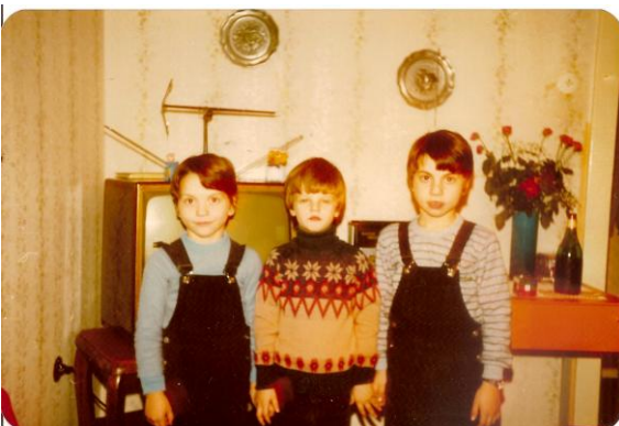
Εικ. 43. Το Ταρζανάκι με δύο Γερμανάκια