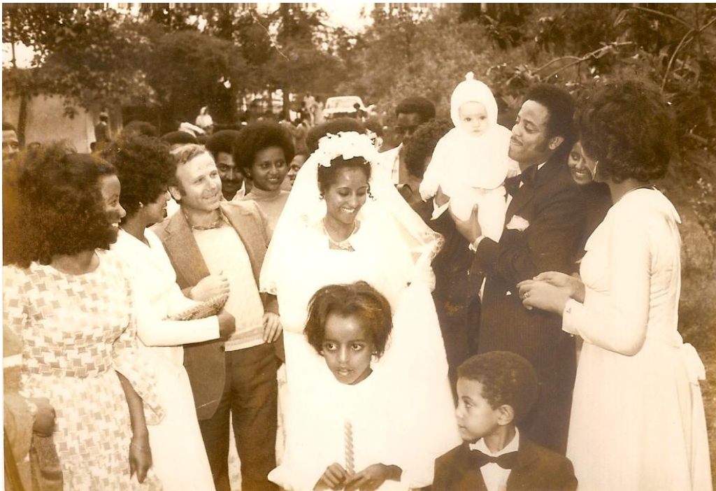
Εικόνα 32. Το Ταρζανάκι στην αγκαλιά του γαμπρού

κάποιοι άλλοι χορεύουν μπροστά από το νεόνυμφο ζευγαράκι! Ο γαμπρός και η νύφη λάμπουν από χαρά! Είναι δυο νεαρά παιδιά με πολύ ωραία αιθιοπικά χαρακτηριστικά! Πλησιάζουμε την ομάδα του νεόνυμφου ζευγαριού και πιάνοντας το χέρι τους δίνουμε τα συγχαρητήριά μας. Συγχρόνως εγώ, που κρατώ το Ταρζανάκι στην αγκαλιά μου, τους δίνω να κρατήσουν στην αγκαλιά τους το μωρό μας. Η νύφη πρώτη παίρνει στην αγκαλιά της το Ταρζανάκι και χαμογελαστή το κοιτάζει με πολλή χάρη. Μετά από λίγο το δίνει στο γαμπρό και εκείνος το σηκώνει ψηλά και το παρατηρεί πόσο χαρούμενο και γελαστό είναι. Το μωρό μας με το λευκό σκουφάκι στο κεφάλι του κοιτάζει κατάματα στο φακό της φωτογραφικής μηχανής, ενώ όλοι οι παριστάμενοι γύρω του χειροκροτούν. Η σκηνή είναι καταπληκτική και μοναδική! Όλοι χειροκροτούν το ζευγαράκι με το Ταρζανάκι στην αγκαλιά τους! Τους λέμε ότι το έθιμο αυτό, να κρατάνε οι νεόνυμφοι ένα παιδάκι στην αγκαλιά τους αμέσως μετά το γάμο τους, το έχουμε στην Ελλάδα για να κάνουν πολλά και ωραία παιδιά. Αμέσως απαντούν ότι και οι ίδιοι έχουν αυτό το έθιμο! Σκέφτομαι λίγο μέσα μου και αποφαίνομαι ότι σ' όλα τα μήκη και τα πλάτη της γης η ψυχή του ανθρώπου είναι ίδια και απαραλλάκτη!