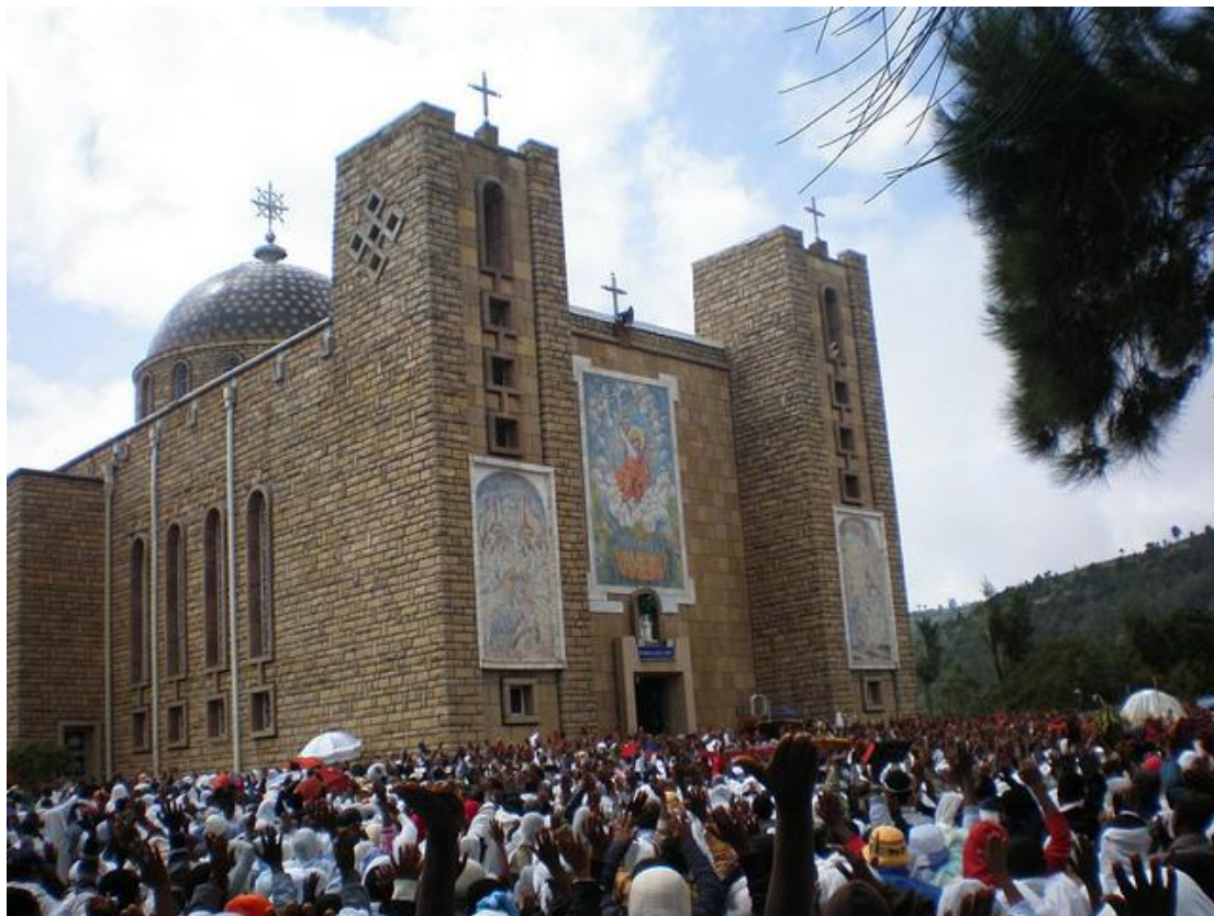
Εικόνα 14. Το μοναστήρι του Αρχαγγέλου Γαβριήλ στο Κουλουμπί