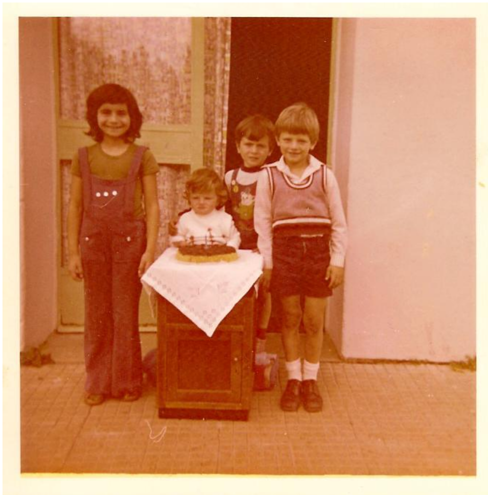
Εικόνα 36. Το Ταρζανάκι γιορτάζει τα πρώτα γενέθλια με τα παιδιά

Μετά τη Μεγάλη Γιορτή των Γραμμάτων των Τριών Ιεραρχών ήρθε ο Φεβρουάριος με τις γραπτές εξετάσεις των παιδιών του πρώτου εξαμήνου, που κρατούν δέκα πέντε μέρες. Πριν τελειώσουν οι εξετάσεις σε όλα τα μαθήματα φέτος ήρθε νωρίς και η Κυριακή της Αποκριάς, γιατί το Πάσχα ήταν στις 10 Απριλίου. Τα παιδιά μας ακολουθώντας τα τοπικά έθιμα της ιδιαίτερης πατρίδας επιθυμούν να κάνουν κάτι από τα δρώμενα των περιοχών τους. Να ντυθούν αποκριάτικες στολές, όσα έχουν, να φορέσουν διάφορα παλιά ρούχα με καπέλα και μπαστούνια, να γίνουν καρναβάλια και να τραγουδήσουν τα αποκριάτικα τοπικά τραγούδια τους.