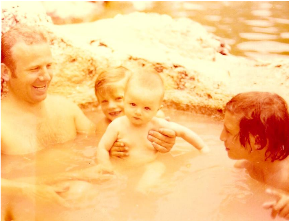
Εικόνα 26. Στην πισίνα του Ambo

Μπαίνουμε στη ρεσεψιόν του ξενοδοχείου και παρατηρούμε ότι εδώ υπάρχουν μοντέρνα και εξαιρετικά πλούσια έπιπλα και, όπως βλέπουμε, γύρω-γύρω υπάρχουν αρκετά δωμάτια και κοινόχρηστοι χώροι με πολλές διευκολύνσεις. Καλημερίζουμε την κοπέλα και ζητούμε, αν μπορούν, να μας ετοιμάσουν κάτι για να μεσημεριάσουμε. Η κοπέλα ευγενέστατα μας απαντάει στα αγγλικά ότι το ξενοδοχείο είναι πολυτελείας και μπορεί να μας ετοιμάσει ό,τι επιθυμούμε. Δίνουμε τις παραγγελίες μας και βγαίνουμε έξω κατευθυνόμενοι προς την πισίνα. Τα παιδιά μας τρέχουν και ζητούν επίμονα από τις μάνες τους τα μαγιώ για να μπουν στην πισίνα. Τους λέμε να μη βιάζονται, γιατί σήμερα ο καιρός είναι εξαιρετικά καλός και ζεστός και θα έχουν όλη τη μέρα μπροστά τους να κάνουν μπάνιο, να παίξουν στο γρασίδι, να τρέξουν γύρω στους κήπους και να κάνουν όλες τις τρέλες τους.