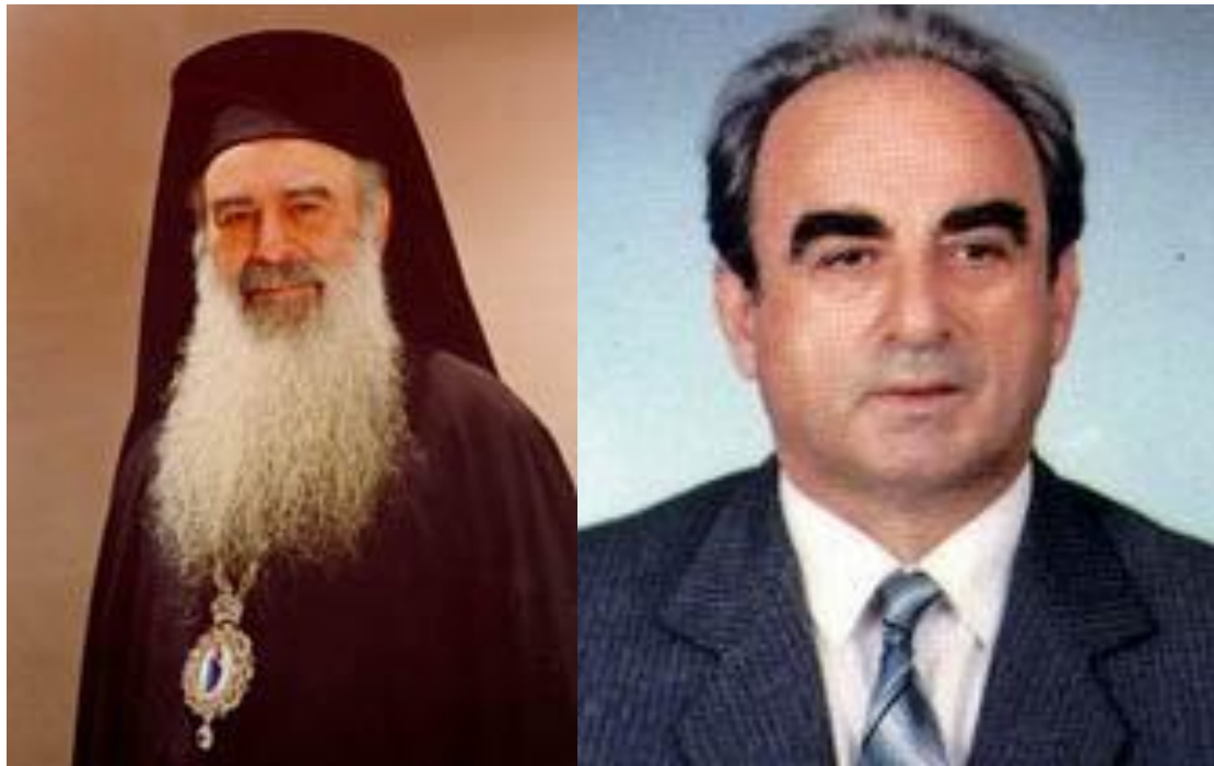
Εικόνα 20. Ο Επίσκοπος Μεθόδιος Φούγιας Εικόνα 19. Ο Δρ Παναγιώτης Φούγιας

είχαν αναλάβει ο Μορφωτικός Ακόλουθος και πίσω απ' αυτόν σίγουρα ήταν και ο Δεσπότης μας. Έτσι η υπόθεση της ασθένειας της Μαρίκας είχε καλό τέλος και πριν από την Μεγάλη Εθνική Γιορτή της 25ης Μαρτίου η Μαρίκα βρισκότανε στο διαμέρισμά τους.