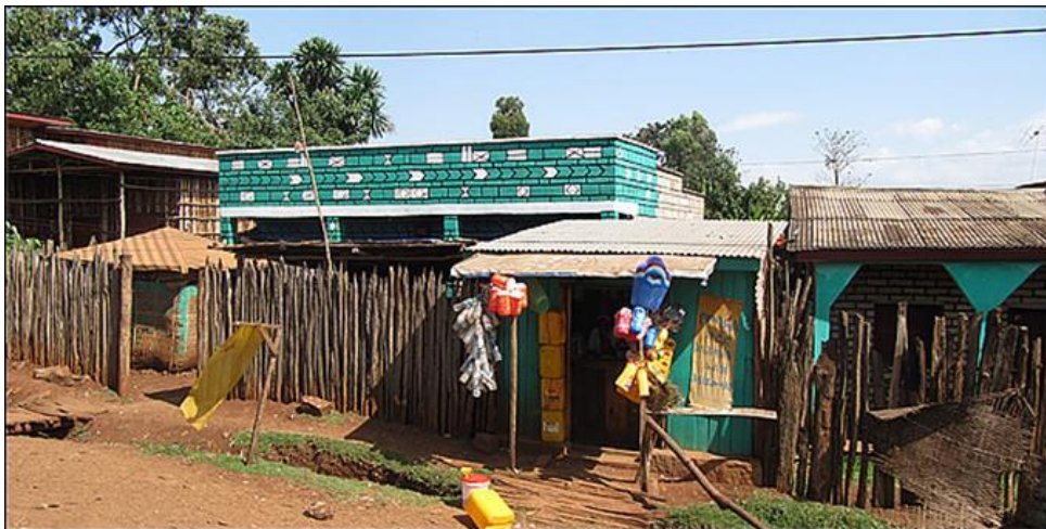
Εικόνα 7. Αιθιοπικά σπίτια

Οι πόλεις στην Αφρική βρίσκονται πάνω στα βουνά. Εκεί υπάρχουν φαρδιά και μεγάλα υψίπεδα που είναι φαντασμαγορικά. Το υψόμετρο είναι μεγάλο, πολύ μεγάλο. Πάνω από τα δυο χιλιάδες μέτρα. Ο αέρας είναι λίγος και αραιός. Η κίνηση γίνεται με βραδύ ρυθμό. Το περπάτημα το καταλαβαίνεις ότι είναι δύσκολο. Η αναπνοή σου κόβεται απότομα, αν επιταχύνεις το βάδισμά σου. Η θερμοκρασία στην Αφρική είναι σταθερή πάνω στα υψίπεδα. Το βράδυ κατεβαίνει στους δέκα βαθμούς πάνω από το μηδέν, ενώ το μεσημέρι ανεβαίνει μέχρι τους είκοσι πέντε και καμιά φορά στους είκοσι επτά. Στα χαμηλά η θερμοκρασία είναι πολύ υψηλή. Γι' αυτό και οι πόλεις των αφρικανών βρίσκονται ψηλά στα υψίπεδα των βουνών!