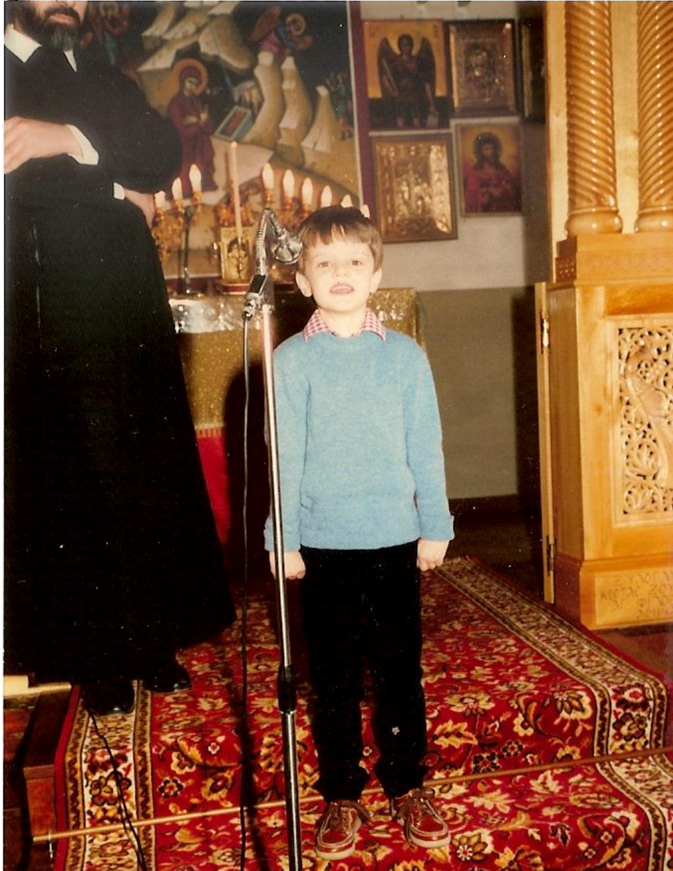
Εικόνα 44. Το Ταρζανάκι απαγγέλλει ποίημα στο γιορτή της 25ης Μαρτίου 1982

τις τρεις ακολουθούσαν άλλοι δυο Εσπερινοί σε διαφορετικές πάντα πόλεις. Οι δυο εκκλησίες στα 1981-82 στεγάζονταν σε αίθουσες, που είχαν παραχωρηθεί από τους Γερμανούς και είχαν διαρρυθμιστεί κατάλληλα με τις άοκνες ενέργειες του ιερέα και πολλών ευλαβών χριστιανών για να γίνουν εκκλησίες. Σήμερα οι δυο εκκλησίες έχουν κτιστεί σε ιδιόκτητα οικόπεδα της ενορίας και είναι περικαλλέστατα κτίσματα. Κοσμούν τις πόλεις του Χάγκεν και Λύντενσαϊντ και μαρτυρούν με τον καλύτερο τρόπο το μεγάλο ελληνοχριστιανικό έργο του πατέρα Γεωργακάκη.