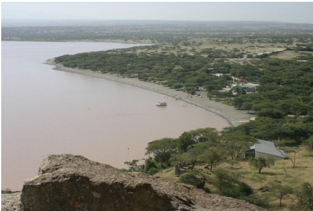
Εικόνα 29. Η παραλία της λίμνης Langanos

Θέλουν όμως να κάνουν και μπάνιο στη λίμνη. Δε το ρωτήσαμε αυτό, που είναι το βασικότερο! Ξαναμιλάμε στην κοπέλα, αν μπορούμε να κάνουμε μπάνιο στη λίμνη και πόσο μπορεί κανείς να απομακρυνθεί από την παραλία. Μήπως η λίμνη έχει ρουφήχτες ή μεγάλα και επικίνδυνα ψάρια ή κροκοδείλους; Η απάντηση είναι ότι άνετα μπορεί κανείς να κάνει μπάνιο κοντά την παραλία, αλλά δεν το συνηθίζουν οι επισκέπτες εξαιτίας του χρώματος των νερών της λίμνης. Σχεδόν όλοι περιφέρονται κατά μήκος της παραλίας και παρακολουθούν το φανταστικό τοπίο με την ποικιλία των δέντρων και των πουλιών. Άλλοι απομακρύνονται λίγο από το ξενοδοχείο για να συναντήσουν τους μεγάλους πιθήκους, που κατεβαίνουν με την ακολουθία τους από τα ψηλότερα να σβήσουν τη δίψα τους στα νερά της λίμνης. Ενώ κάποιοι άλλοι τραβούν απέναντι από το ξενοδοχείο και περνώντας το δρόμο παρακολουθούν τα πολύχρωμα πουλιά του Εθνικού Πάρκου πάνω στα δέντρα και ιδιαίτερα τους παπαγάλους, που σφυρίζουν τόσο δυνατά που σε ξεκουφαίνουν!