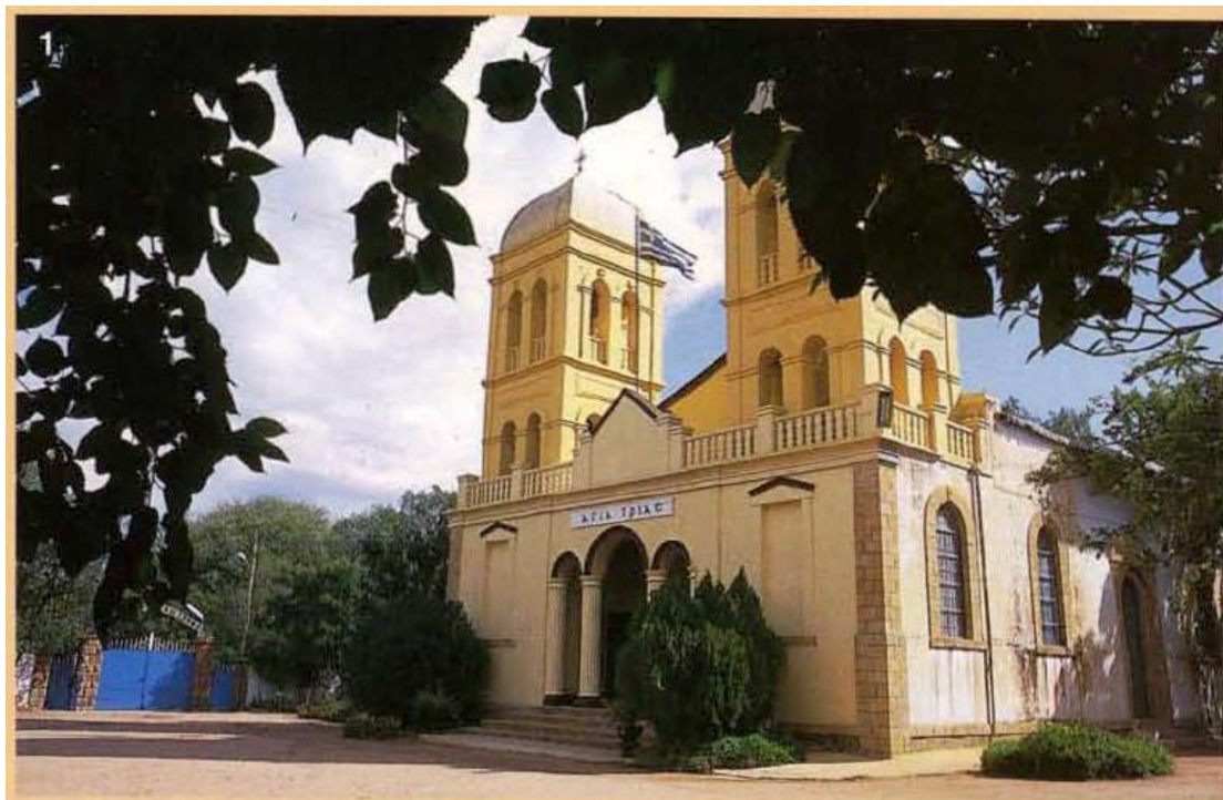
Εικόνα 15. Η εκκλησία της Αγίας Τριάδας στη Dire Dawa