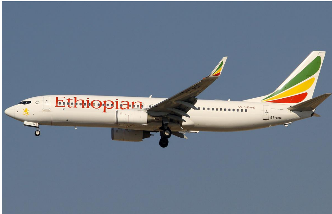
Εικόνα 1. Αεροπλάνο των Αιθιοπικών Αερογραμμών

Βρισκόταν στον τέταρτο μήνα της εγκυμοσύνης της. Με την απογείωση του αεροπλάνου ένωσα κάποιο σφίξιμο μέσα μου, μου λέει. Ελαφρώς μου δημιουργήθηκε κάποια τάση για εμετό, αλλά τώρα όλα είναι θαυμάσια. Πράγματι μόλις το αεροσκάφος έπιασε το ύψος του, η κίνησή του ήταν φανταστική. Μιλώντας μαζί της για να μη νιώθει μόνη, σε μισή ώρα και κάτι αντικρίζουμε από κάτω μας φώτα σα κουκίδες. Πολλά φώτα, αλλά πολύ μικρά. Με τα λίγα αγγλικά μου ρώτησα την αεροσυνοδό που βρισκόμαστε. Εκείνη μου αποκρίθηκε ότι πετάμε πάνω από την Κρήτη στα είκοσι χιλιάδες πόδια πάνω από τη θάλασσα.