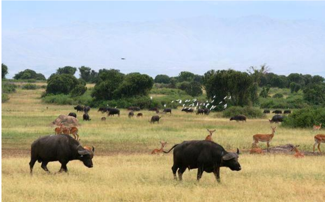
Εικόνα 16. Αιθιοπική σαβάνα

σηκώνουν το κεφάλι τους και να εποπτεύουν τη γύρω περιοχή. Παραδίπλα τους παραδοκούν τα μεγάλα σαρκοφάγα. Οι ύαινες κατά κοπάδια σταματούν στα ακούσματα του τρένου και κοιτάζουν περιέργα το συρμό. Οι μεγάλες γαζέλες με τα τεράστια κέρατα τρέχουν φοβισμένες, ενώ κάπου μακριά αντικρίζουμε ιθαγενείς να σέρνουν τις καμήλες τους. Εδώ στη σαβάνα την εξουσία κρατάει το λιοντάρι. Το τοπίο είναι ξέφωτο και ανοιχτό. Το λιοντάρι δεν καταδέχεται τις πυκνές λόχμες. Πλαγιάζει ανάμεσα στους χαμηλούς θάμνους αθέατο και βυθισμένο ολημερίς σε μακάριο ύπνο. Μόλις πιάσει η νύχτα ανασηκώνεται, τεντώνει το αυτί του, γυροφέρνει τη ματιά του δεξιά και αριστερά και οσμίζεται τον αέρα για να εντοπίσει το θήραμα. Ύστερα προχωρεί με μεγάλα πηδήματα και πηγαίνει να πολεμήσει. Όχι για να κλέψει, όπως κάνουν οι ύαινες. Συνήθως δείχνεται νωθρό, γιατί νιώθει την απόλυτη ασφάλεια. Η σαβάνα είναι η απέραντη επικράτειά του.