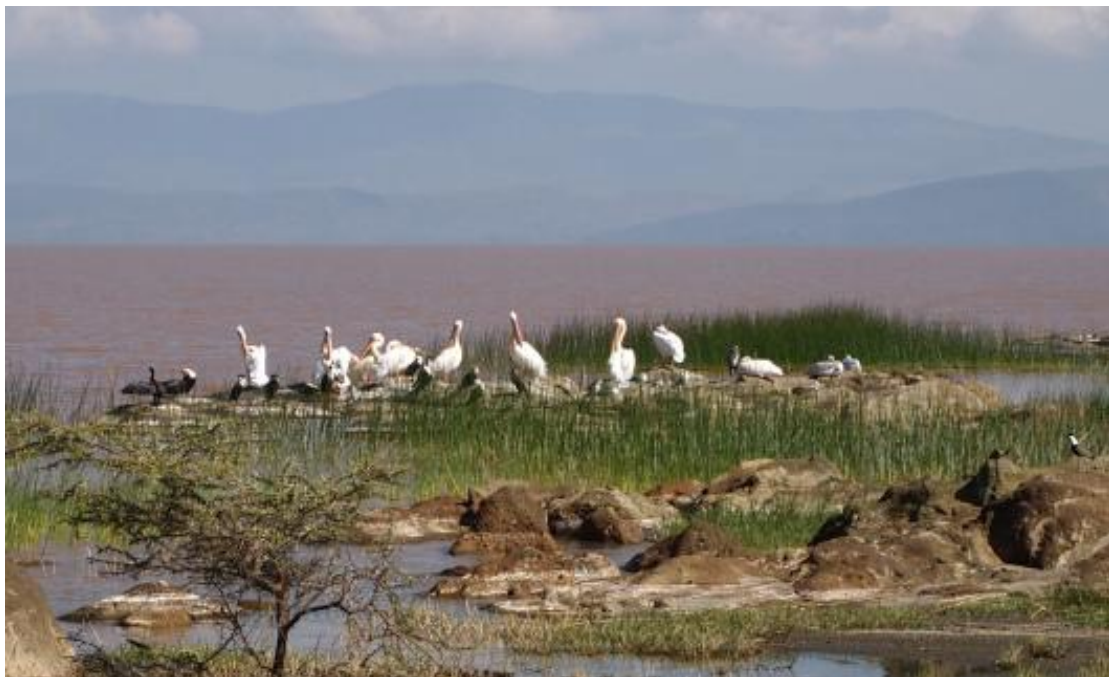
Εικόνα 30. Η λίμνη Langano με τα πουλιά