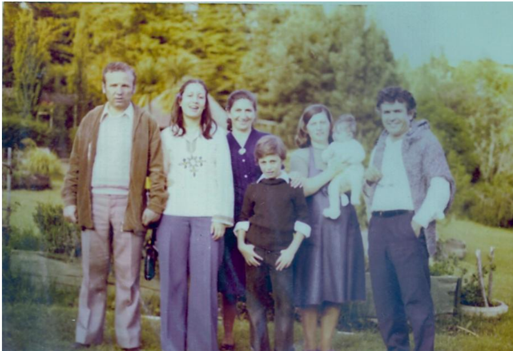
Εικόνα 27. Κάπου στην εξοχή

Αφρική κοντά στα λιοντάρια, τους πιθήκους και τον Ταρζάν. Αμέσως θυμήθηκε τα πρωινά λόγια του θυμόσοφου Μανιάτη γέροντα και απευθυνόμενος στην Κουντουσάν της ξαναλέει αιθιοπικά να ετοιμάζεται να ταξιδέψει στην Ελλάδα για να μεγαλώσει το Ταρζανάκι. Εκείνη όμως, καθώς είναι ετοιμόλογη και αρκετά έξυπνη, αμέσως του απαντάει ότι αυτό είναι αδύνατο, γιατί δεν μπορεί να αφήσει τους γονείς και τα αδέρφια της εδώ και αυτή να βρίσκεται σ' άλλη χώρα!