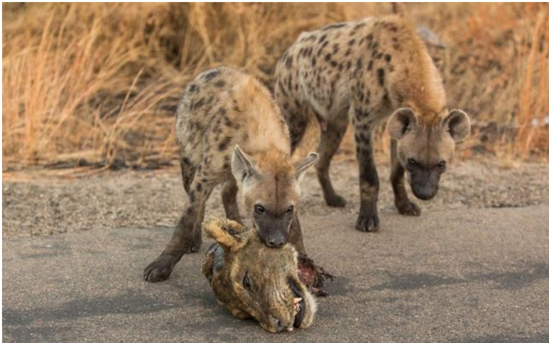
Εικόνα 24. Ύαινες στους αιθιοπικούς δρόμους