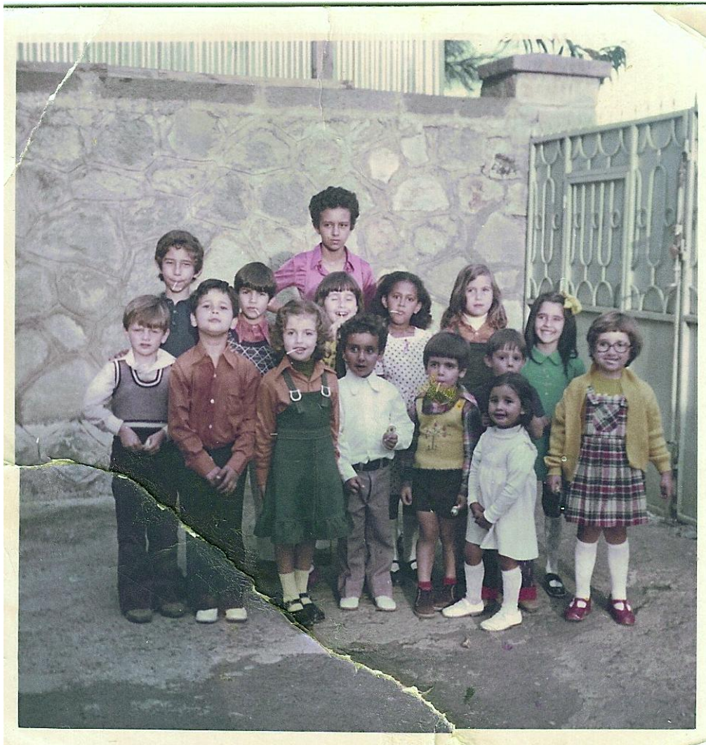
Εικόνα 8. Η Α΄ τάξη του Δημοτικού Σχολείου 1975-76

συναδέλφοι με τις οικογένειές τους, που όλοι μαζί συμποσούνται περίπου στους εκατόν τριάντα ανθρώπους. Φοβούνται ότι θα υπάρξει πρόβλημα για τον επισιτισμό τόσων ατόμων! Τους βλέπουμε να συνεδριάζουν συνεχώς τα βράδια και τα νέα που φτάνουν δεν είναι ευχάριστα. Η υπεύθυνη του εστιατορίου μας λέγει ότι οι άνθρωποι, που φέρνουν τρόφιμα στην Κοινότητα, μιλούν με τα πλέον μελανά χρώματα για την κατάσταση και τις δυσκολίες για την εισαγωγή τροφίμων από το εξωτερικό. Ευτυχώς η χώρα είναι αυτάρκης σε γεωργικά προϊόντα και κρέατα. Ο φόβος είναι για τους ξένους και τους λίγους πλούσιους κατοίκους της Αιθιοπίας, που επιζητούν είδη τροφίμων από το εξωτερικό. Όπως γάλατα, κρέμες και είδη πολυτελείας. Αυτά τα είδη, ιδίως τα γάλατα και οι κρέμες ενδιαφέρουν και την οικογένειά μου. Σε λίγους μήνες θα έρχονταν το παιδάκι μας και έπρεπε να έχουμε γάλατα, κρέμες και άλλα χρήσιμα για το μωρό!