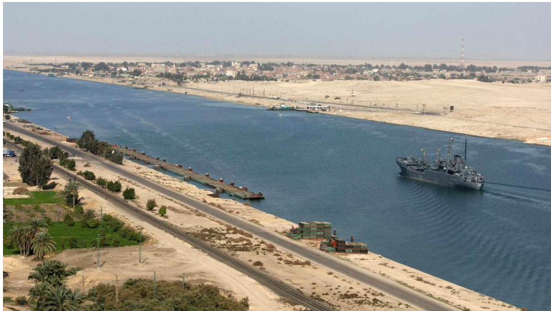
Εικόνα 2. Η νέα διώρυγα του Σουέζ

Η νέα διώρυγα αποτελεί γεγονός υψίστης σημασίας τόσο σε ιστορικό όσο και οικονομικό επίπεδο, γιατί άλλαξε ριζικά πια το ιστορικό παρεθλόν της διώρυγας καθώς και το καθεστώς της παγκόσμιας ναυσιπλοΐας στην περιοχή!