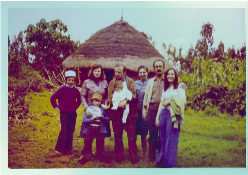
Εικόνα 25. Οι δύο οικογένειες μπροστά σε ένα αιθιοπικό τοκούλι